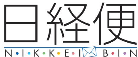
通常ノーマル仕様