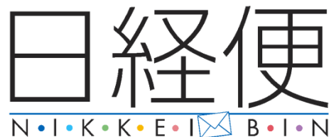
通常ノーマル仕様